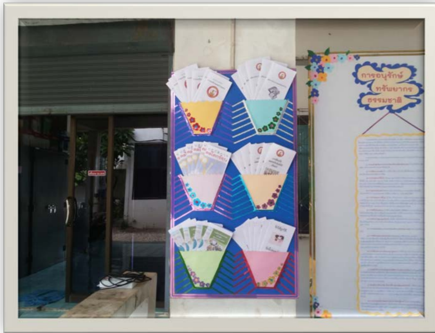
บอร์ดประชาสัมพันธ์